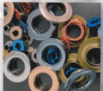
PVD | PVD