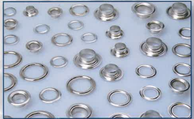
Digital printing | Stampa digitale