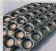
Stainless Steel Inox