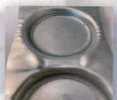
Zinc coated Alluminato

Available in a large range of colors | Disponibili in varie finiture