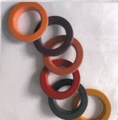
Painted | Verniciate