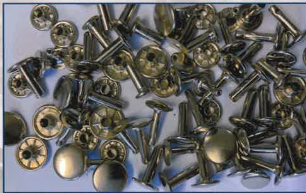
Rivets | Rivetti