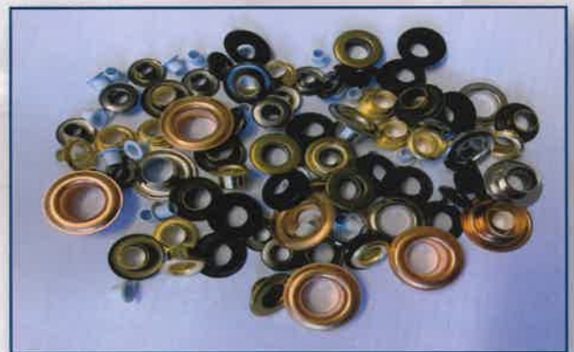
Fashion & footwear | Pelletteria e abbigliamento