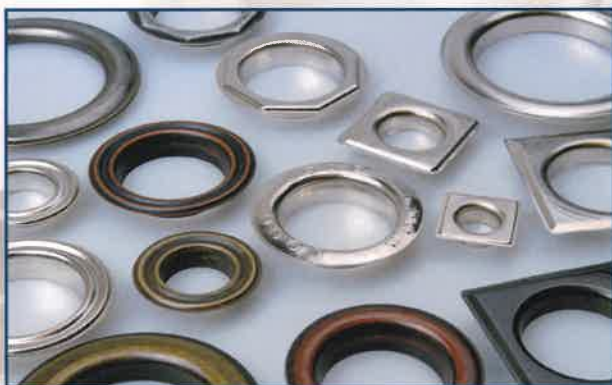
Curtains | Tende da interno