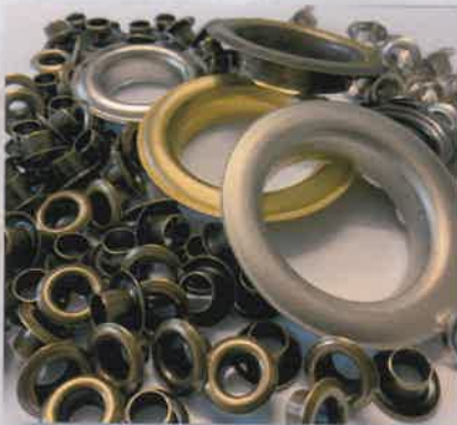
Galvanic | Galvaniche

Available in a large range of colors | Disponibili in varie finiture