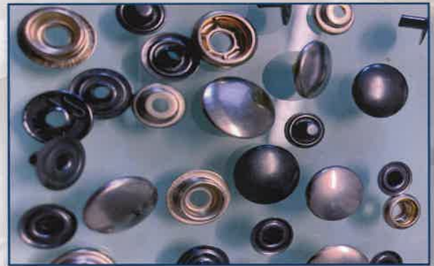
Snaps fasteners | Bottoni a pressione