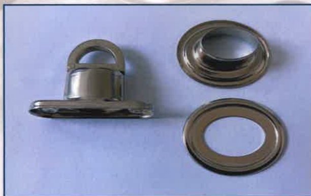
Tourniquets | Girelli