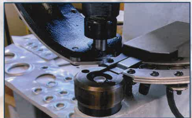
Machines | Macchine per l'applicazione