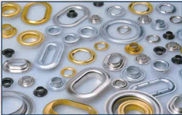
Industry & covers | Coperture impermeabili